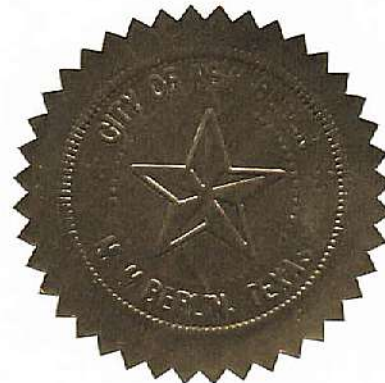
City Seal (Sello de la ciudad)

September 16, 2024 Date of adoption (Fecha de adopción)